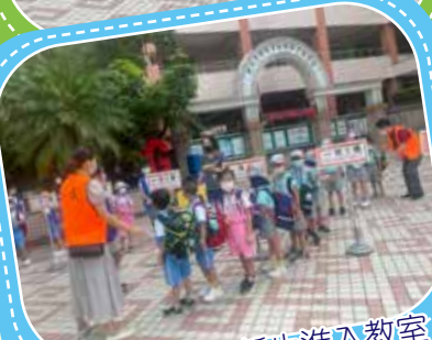
老師帶領小一新生進入教室