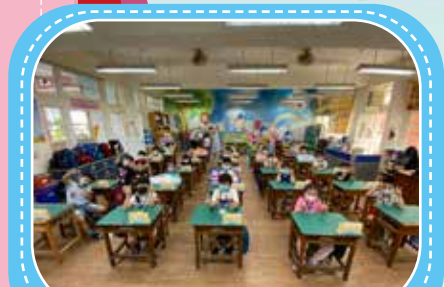
我們是 SUPER 小一生!

今年學校的開學與以往很不一樣，在嚴峻的疫情考量下，教育部規定在開學後，不開放家長入校，這樣的規定讓不少小一新生的家長非常緊張，但父母還是要學習放手，相信孩子能做到！這群史上最勇敢的小一新生，第一天就自己踏進校園，加入光復大家庭，孩子真的很棒唷！學校為了讓家長安心，在開學當天以及之後的一週內，安排專人老師帶領這群孩子進入教室，讓小一新生逐漸熟悉到班級的動線及環境。開學當天，校長分別到一年級各班加油打氣，致贈智慧筆及繪本，期許孩子多閱讀，長智慧！校園充滿愛與善的氛圍，讓孩子上學安心，開心上學！