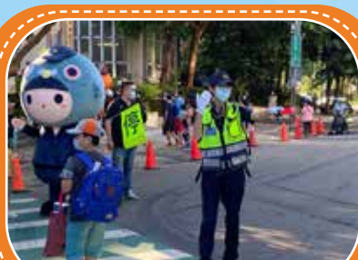
交通警察指揮校園周邊交通