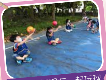
小花鹿好朋友一起玩球