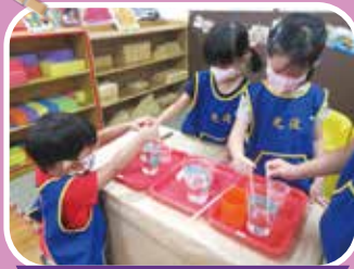
小企鵝會互相幫忙

幼兒喜歡主動、親近身邊的人、事、物並與他人互動，喜歡發問、探索並自由的遊戲。因此幼兒園老師安排各項讓幼兒親身參與、體驗以及與他人一起互動的機會，不僅讓幼兒擁有健康的身心，更引導幼兒能學習與他人友愛相處，同時關懷生活環境，培養對周遭人、事、物的熱情與動力。