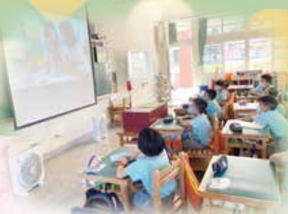
觀賞「記疫的模樣」敬師影片