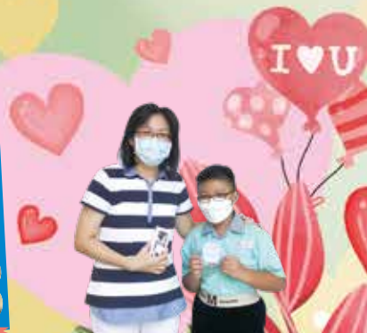
學生與感謝的老師合照