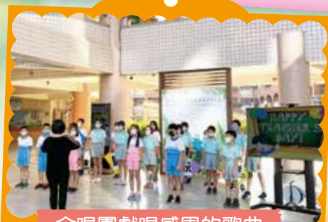
合唱團獻唱感恩的歌曲