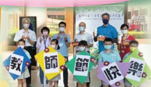
家長會致贈全校教師茶點感謝老師