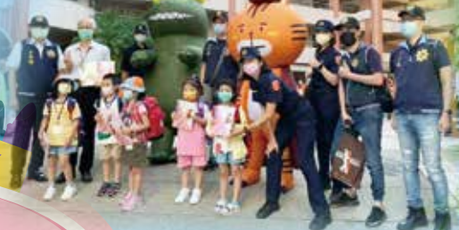
警察婦幼隊到校維護上學安全