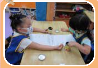
紅豬班 - 訪問我的好朋友