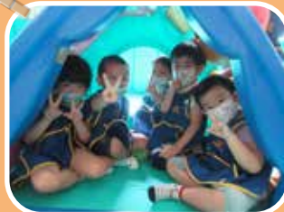
海豚班 - 我們一起玩遊戲