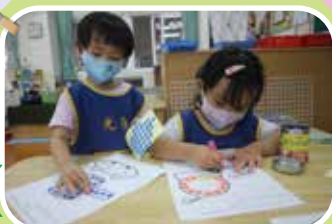
綠蛙班 - 和好朋友一起貼貼紙