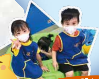
白鯨班 - 我和我的好朋友 坐在甜甜圈上玩遊戲