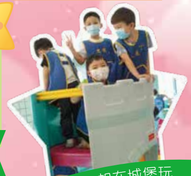
黃蜂班 - 一起在城堡玩