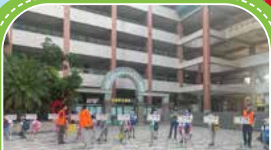
小一新生依序排隊準備