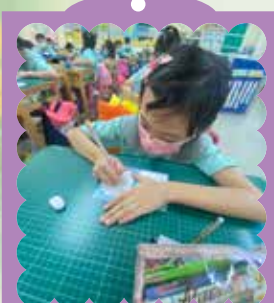
學生書寫祝福小卡