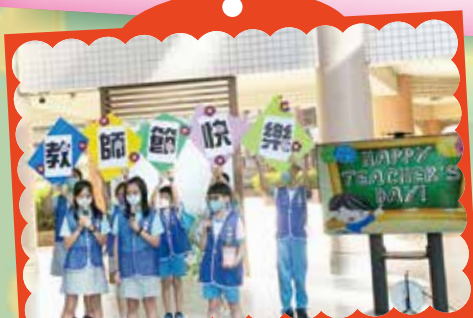
自治市團隊祝福老師教師節快樂