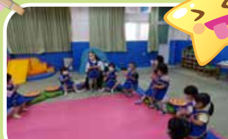
飛魚班 - 一起幫同學慶生 唱生日快樂歌