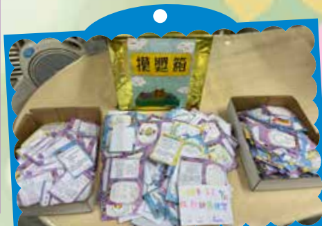
學生踴躍參加有獎徵答及祝福小卡