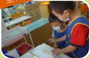
紫蝶班 - 小天使教小主人畫畫