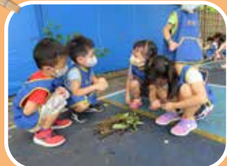
棕熊班 - 我們一起來炒菜