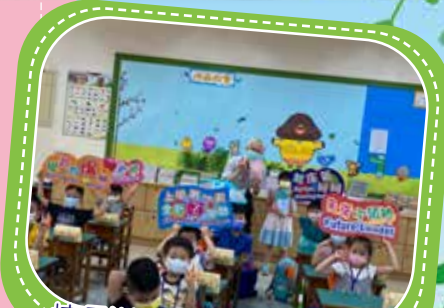
校長送新生智慧筆及繪本