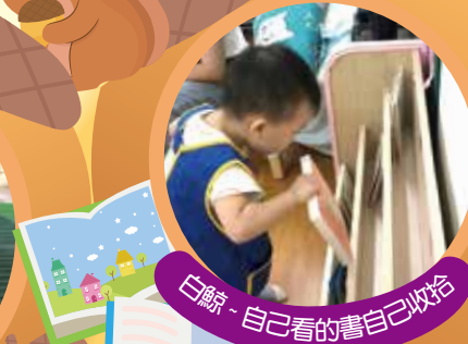
白鯨 - 自己看的書自己收拾