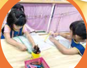
企鵝 - 我會自己整理事物

常聽家長說：「老師，孩子比較聽你的話，請你跟他講……」。如果您也願意高「放」貴手，孩子會有令人驚豔的表現喔！我們這群年紀小但能力好的寶貝，不但已經適應團體生活，而且還學會照顧自己的本領呢！