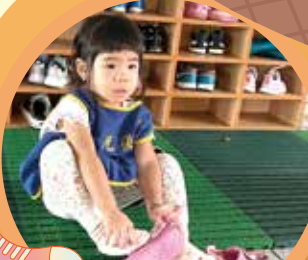
飛魚 - 我會穿鞋