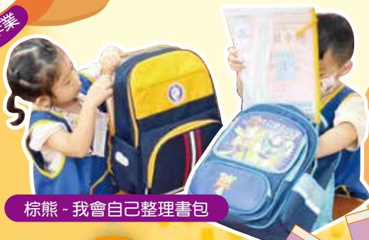
棕熊 - 我會自己整理書包