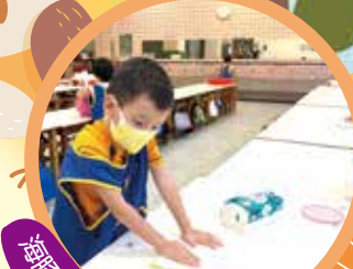
海豚 - 用完餐我會收拾碗擦桌子