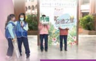
關懷 - 戲劇宣導

亞里斯多德說：「品德的獎賞是幸福」，幫助學生培育豐盈生命的人生資產，是實踐品德教育的堅持與心意。我們深信好品德、好幸福，期許光復學子都能有好品德，好未來！