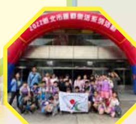
六年 5 班參加 2022 運動樂活 - 大隊接力