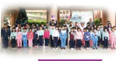
責任 - 表揚品德星光