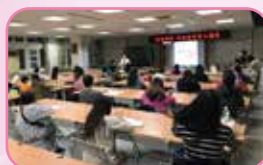
有效經營家庭關係， 讓家人的心更緊密相連

親情，是世界上最甜蜜的負荷，而父母教育孩子的歷程，其實也是自身不斷感悟、學習和圓滿的過程。所有付出的努力，都將會讓彼此的生命更加緊密的連結在一起，也將會印證在孩子無可限量的未來！