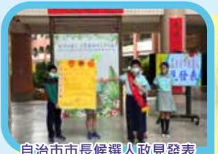
自治市市長候選人政見發表

本校「自治市小市長」的選舉，於 3 月 29 日進行投開票，選舉出新一屆的自治市小市長，為兒童權利的推動扎根。今年共有 10 組小市長候選人投入選舉活動，各組候選人自組競選團隊，利用兒童朝會辦理政見說明會，候選人提出的政見包括有「新增便服日、增加圖書館借書數量、午餐時間開放點歌、增加運動及遊樂設施、舉辦體育比賽」等等，都相當具體反映了孩子們的心聲。學務處同時進行競選影片拍攝，架設投開票箱及帷幕，模擬真實投票情境，一點兒也不輸正式選舉活動。在班級老師指導下，學生們實際參與公民活動，依序排隊進行領票、圈選，並投下手中神聖的一票，選舉出未來新的自治市小市長，也上了民主寶貴的一課。