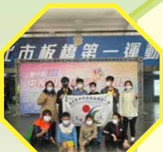
田徑隊參加 111 年新北市小學運動會

3 月份是體育比賽重要月份，一年來的辛苦訓練，都在這時候有舞台可以讓選手們大展身手。雖然去年因疫情停辦許多比賽，但教練們仍舊持續進行各項訓練，希望做好準備，讓選手們能在參賽時有最好的表現。