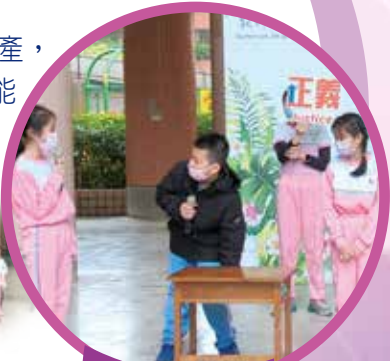
正義 - 戲劇宣導