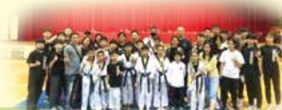
跆拳道參加 111 年新北市小學運動會