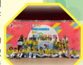
四年 2 班參加 2022 運動樂活 - 國小健身操賽