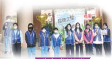
尊重 - 戲劇宣導